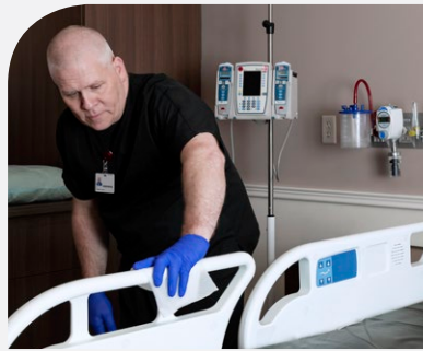
Bed and handrails Cama y barandillas