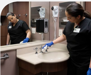
Bathroom sink Lavamanos del baño