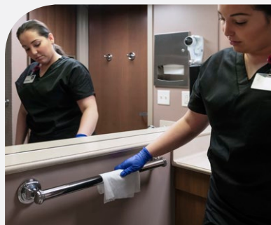
Grab bars Barras de apoyo